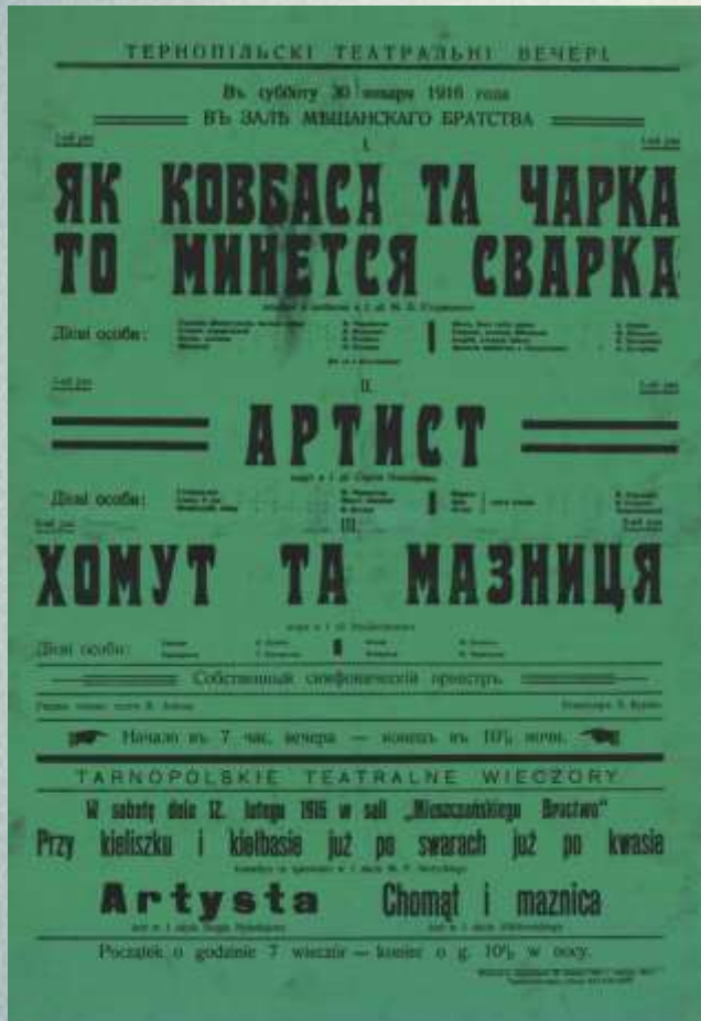
Афіша 1916 року

У 1881 році, після повернення з-за кордону, Михайло Старицький видає перші свої поетичні збірки: «З давнього зшитку», «Пісні та думи».