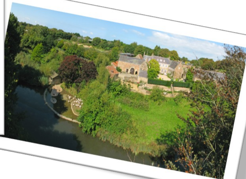
Зовнішній вигляд зоопарку