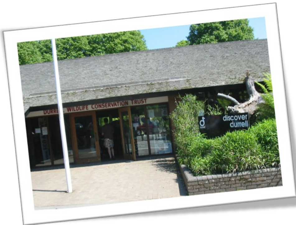
Вхід до зоопарку