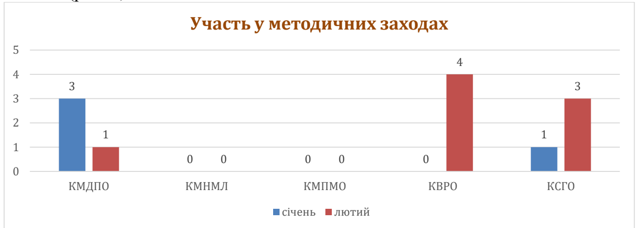
Рис. 2 Участь науково-педагогічних працівників ЦПРПО в методичних заходах Академії

Відповідно до плану науково-методичних заходів Академії на січень-лютий 2024 року науково-педагогічними працівниками ЦПРПО у партнерстві з методистами центрів академії підготовлено та якісно проведено 12 методичних заходів (рис. 2)