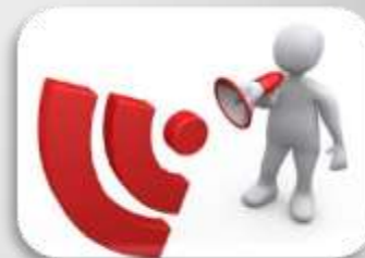
Схема оповіщення груп через Viber