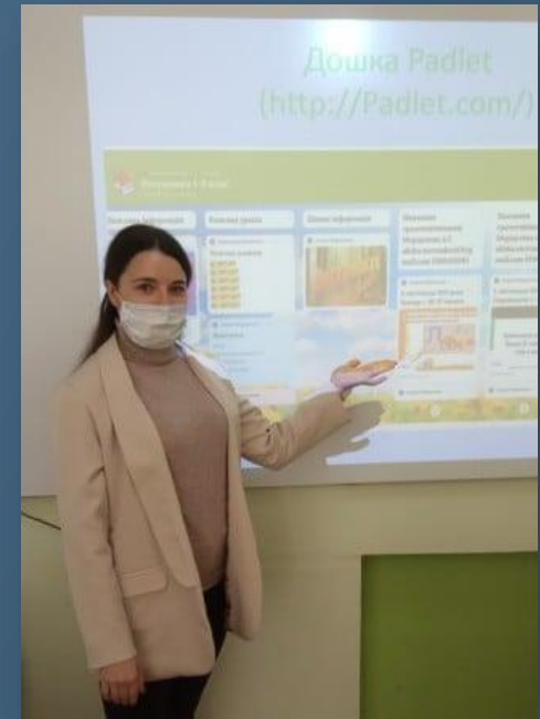
Анкета молодого педагога

Анкета самооцінювання педагогічної майстерності