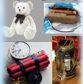
Саморобні вибухові пристрої

У даному виступі представлено вибухонебезпечні предмети, види мінно-вибухових предметів та розроблено рекомендації щодо дій в разі виявлення таких знахідок